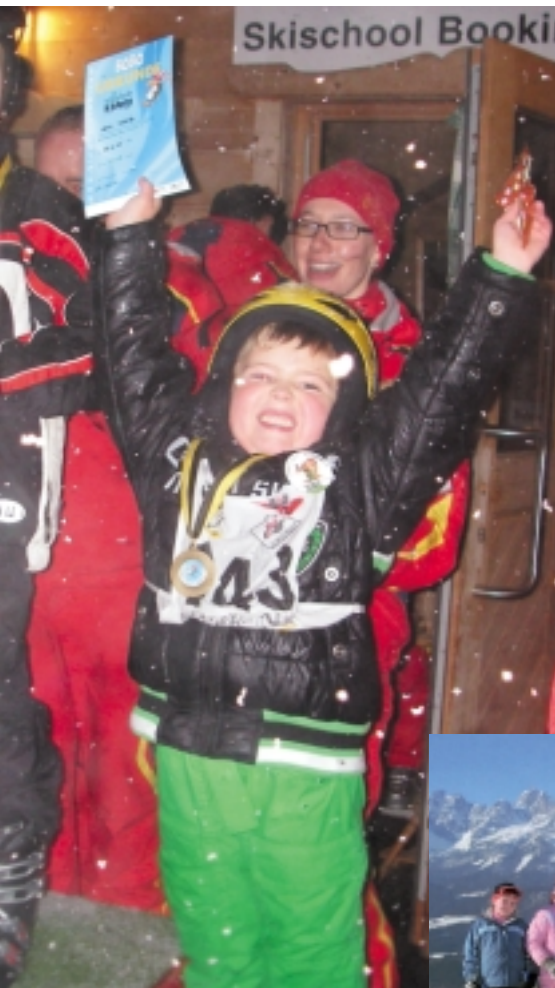
Immer wieder großer Ansturm beim Einheimischen-Skikurs!