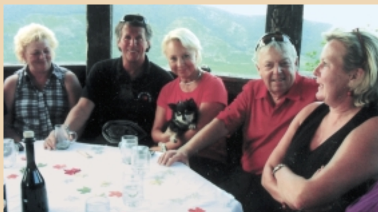
Im Aussichtspavillon hoch über der romantischen Donau kochte Österreichs Gourmet-Köchin (und bekennender Tirolfan!) Liesl Wagner-Bacher (re.) ausnahmsweise nicht selbst.